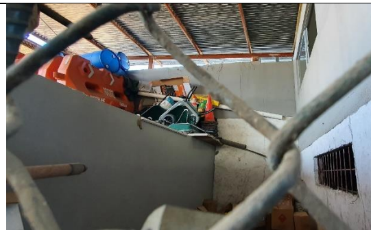
Imágenes del almacenaje de estaciones de aceites y líquidos de la maquinaria.

Se encuentra bajo llave, pero sin embargo hay una ausencia de estantería y almacenamiento adecuado.