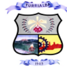
MUNICIPALIDAD DE TURRIALBA CUADRO N.º2 Estructura organizacional (Recursos Humanos)